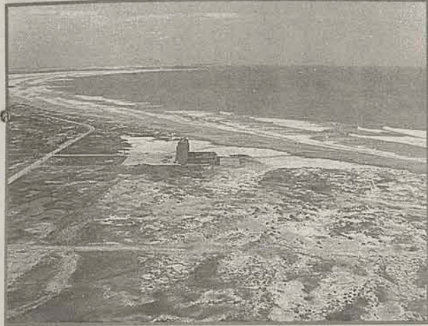
Vista parcial da praia do Mar Grosso, em 1950.