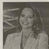
Psicóloga Mestra em Desenvolvimento Socioeconômico Educadora Executiva

O grande desejo para esta reflexão é que você desista de desistir por baixa estima, síndrome de impostor(a) e para isso não há outro caminho, vulnerabilidade para compreender que a exposição ao risco faz parte do nosso crescer, e autoconhecimento para trazer à tona seus talentos à seu favor e à disposição da sociedade. Agora, eu convido você a desistir sim, de tudo aquilo que te distancia da sua essência para simplesmente caber em modelos que não fazem sentido para você, nestes casos, não podemos considerar como uma desistência, mas sim, livramento. Pense nisso!