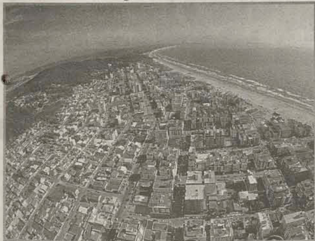
Mesmo local.